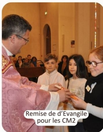
Remise de d'Évangile pour les CM2