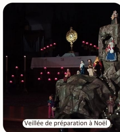
Veillée de préparation à Noël