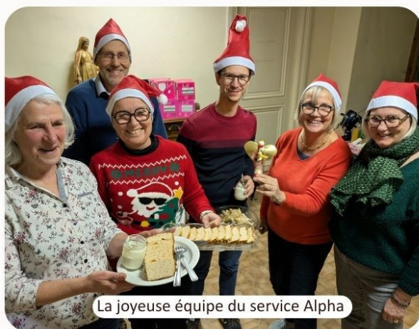
La joyeuse équipe du service Alpha