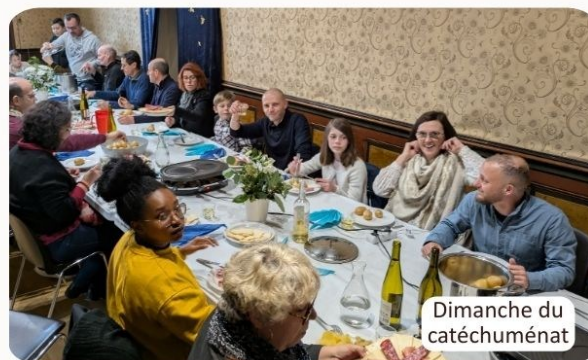
Dimanche du catéchuménat