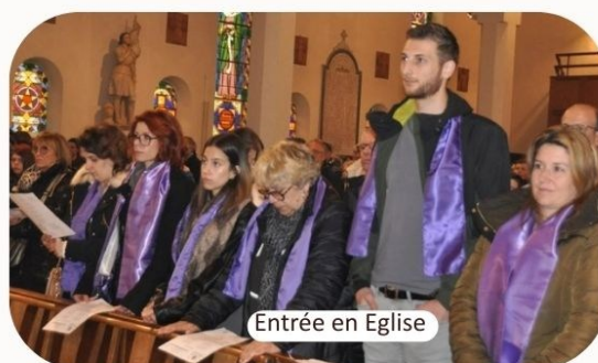
Entrée en Eglise