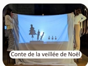
Conte de la veillée de Noël