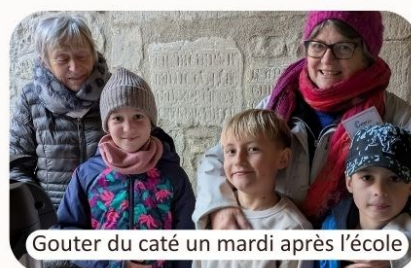
Gouter du caté un mardi après l'école