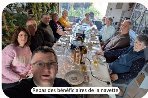
Repas des bénéficiaires de la navette