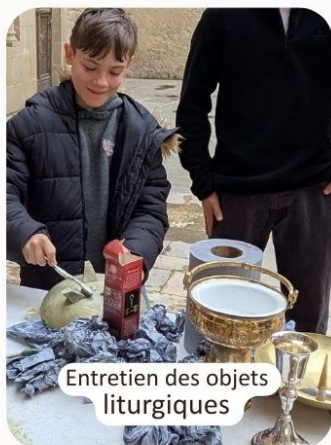
Entretien des objets liturgiques