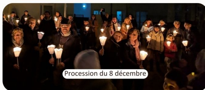
Procession du 8 décembre